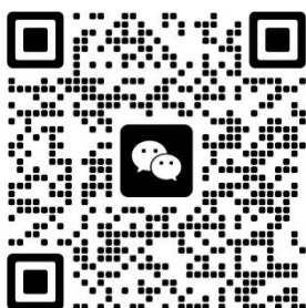
扫码添加咨询微信